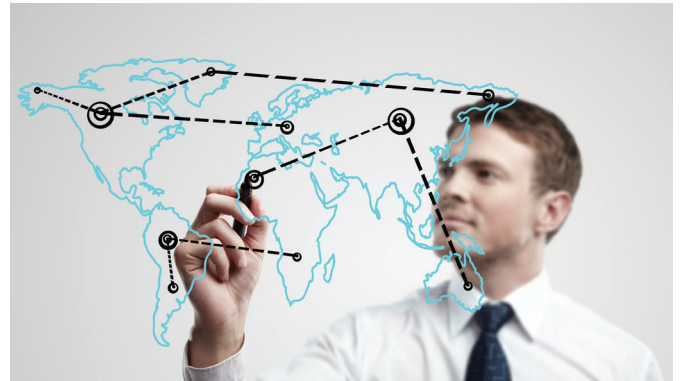
myOpenFactory bietet mehr als Point2Point-Kommunikation.

Der Einkauf verbringt häufig zwei Drittel seiner Arbeit mit operativen Tätigkeiten, wie z. B. mit der Erfassung eingehender Dokumente im ERP-System, der Überprüfung von Abweichungen und der Klärung mit Lieferanten. Etwa 30 Prozent der Zeit entfallen im Einkauf auf Terminverfolgung. Lediglich fünf Prozent der Arbeitszeit verbleiben für den strategischen Einkauf.