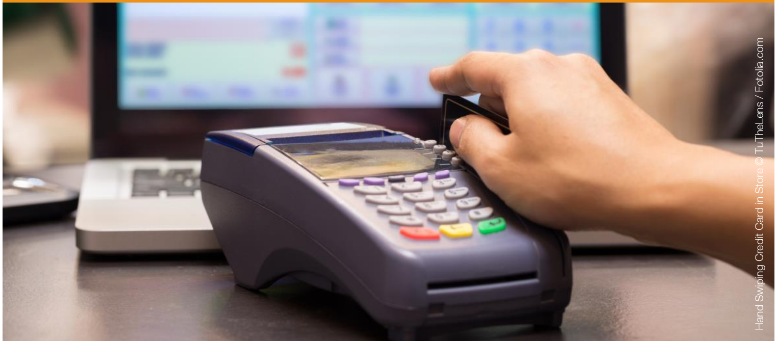
Hand Swiping Credit Card in Store